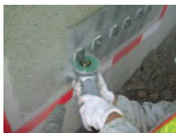
カッター入れ状況