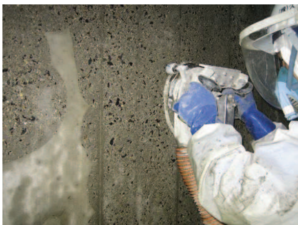
コンクリート表面の目粗し